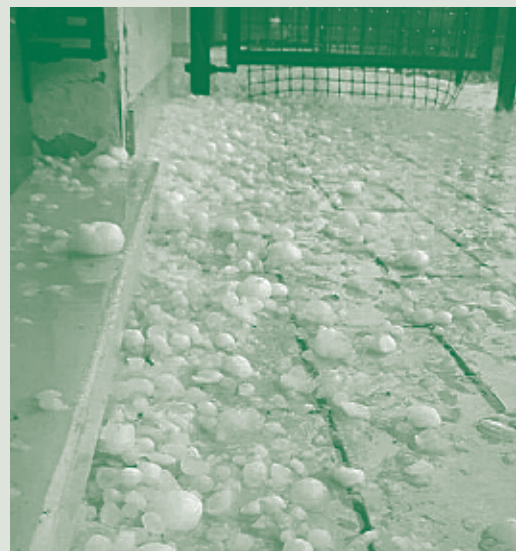
Grandinata a Feltre e Valbelluna, immaginabili i danni!

Il presidente del Veneto Luca Zaia ha firmato il 13 giugno la dichiarazione relativa allo stato di crisi per gli eventi meteorologici che hanno interessato le zone del Feltrino, Valbelluna, Coneglianese e Alto Trevigiano. Il decreto rimane comunque aperto, in attesa che tutti i comuni possano effettuare e concludere il censimento dei danni alle strutture pubbliche e private.